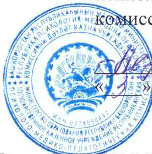
График работы специалистов Филиала ГКУ РПМПК Бирская ЗПМПК в образовательных учреждениях Аскинского района Республики Башкортостан на 2019г.

03.07.2019г. - МБОУ СОШ №1 с.Урмиязы МР Аскинский район РБ;